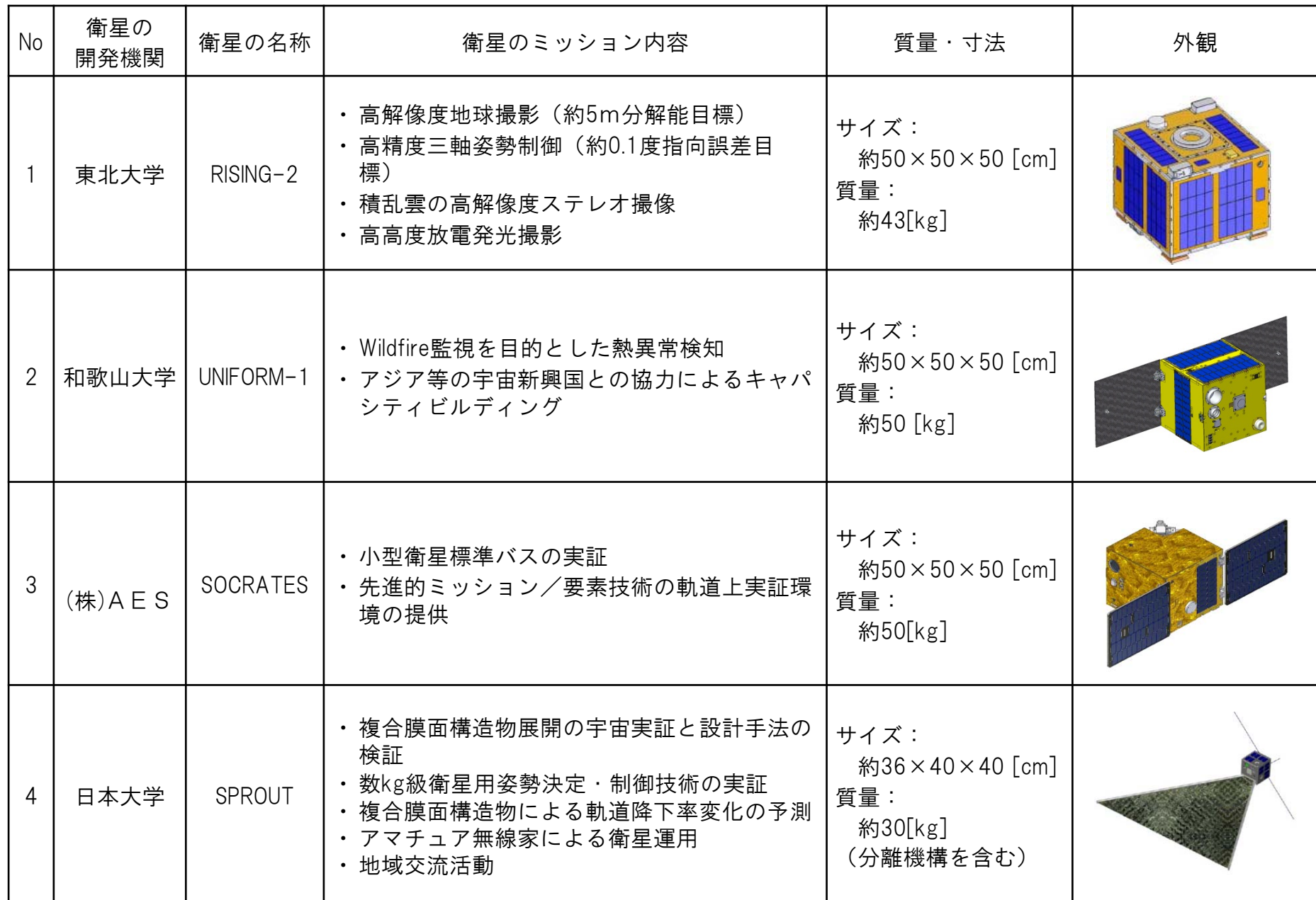
表. 小型副衛星 主要諸元